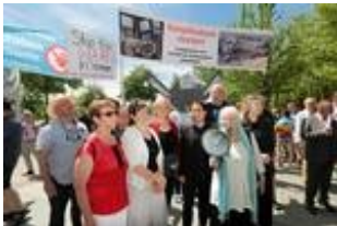
Inge Höger (rot) demonstriert gegen Kampfdrohnen

Inge Höger: Beschaffung von Kampfdrohnen für die Bundeswehr bezeugt Ignoranz der Regierung